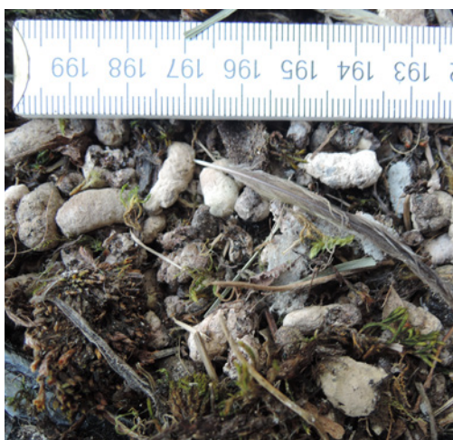
Abbildung 3. Auf diesem Bild ist die charakteristische Form des Mauerseglerkots zu erkennen.