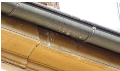
Abbildung 2. Mauerseglerbrutplatz mit den typischen Kotpuren.