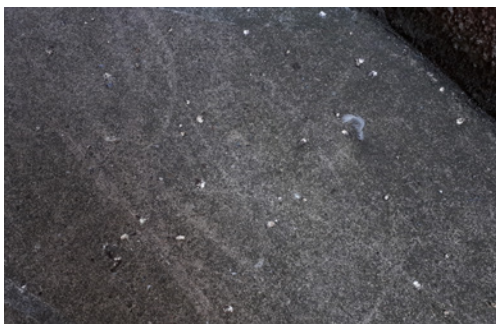
Abbildung 4. Am Boden befindlicher Mauerseglerkot, der insbesondere im Juli festgestellt werden kann, zeigt die aktuelle Belegung eines darüber liegenden Brutplatzes an; typisch ist neben der Form des Kots dessen oft weite Streuung am Boden.