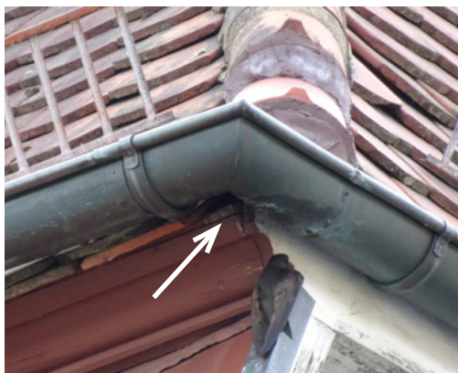
Abbildung 1. Am Brutplatz sitzender Mauersegler; auf diesem Bild ist die Einflugöffnung unter der Dachrinne gut zu erkennen.