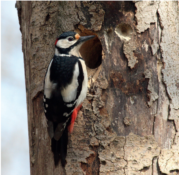
Der Buntspecht baut seine Höhlen normalerweise in Bäume, macht aber auch vor Fassaden nicht halt.

Spechte werden oft als „Baumeister des Waldes“ bezeichnet und erfüllen damit in der Tat eine wichtige ökologische Rolle: Viele Vogel- und andere Tierarten, die selbst keine Höhlen bauen können, sind auf leer stehende Spechthöhlen als Brut- oder Schlafplätze angewiesen. Spechte halten sich aber keinesfalls ausschließlich in Wäldern auf; zu ihrem Lebensraum gehören z. B. auch Streuobstwiesen, Alleen, Parkanlagen und naturnahe Gärten.