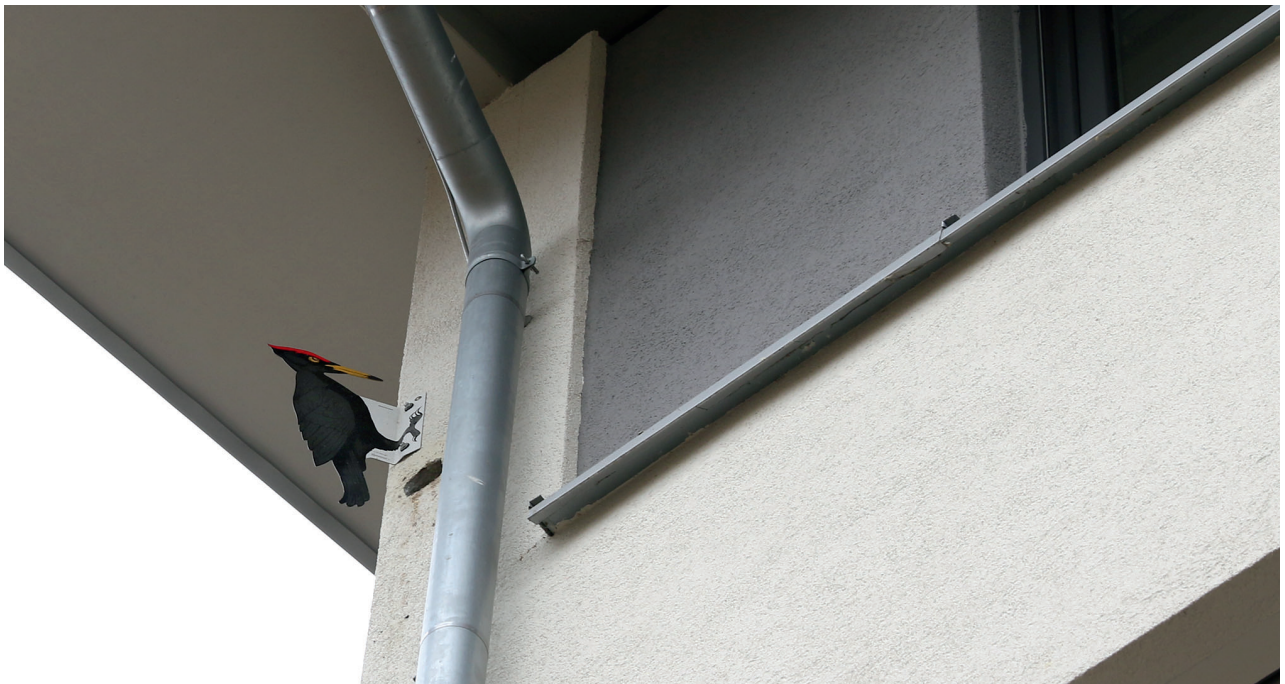
Vermeintlich besetzte Reviere (hier: Schwarzspechtattrappe) werden von Spechten gemieden.

Zitiervorschlag: Theobald J, Mayer J (2023): Spechtschäden an Fassaden – was tun? Im Rahmen der Webseite www.artenschutz-am-haus.de DOI 10.55957/YZEK3588