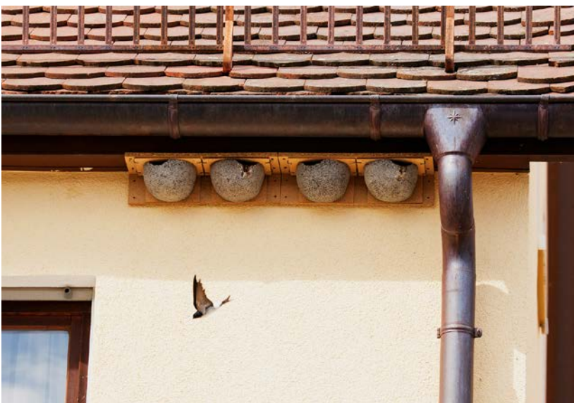
Abb. 2: Eine von zahlreichen Lösungsmöglichkeiten im Gebäude-Artenschutz: Besetzte künstliche Nisthilfen für die Mehlschwalbe ( Delichon urbicum ) unter einem Dachvorsprung.

Es ist eine Selbstverständlichkeit, dass bei Gebäuden die Ansprüche des Menschen an Form und Funktion im Vordergrund stehen. Dies gilt für Neubauten gleichermaßen wie für Sanierung oder Umbau. Auch altersbedingte Schäden an Gebäuden sollen behoben und Gebäude dort, wo es sinnvoll oder erforderlich ist, saniert werden, gerade unter energetischen Gesichtspunkten als Beitrag zum Klimaschutz. Und auch Grünflächen in Städten und Dörfern, egal ob privat oder öffentlich, dienen in aller Regel (soweit keine abweichende Festlegung zum Beispiel infolge eines Bebauungsplanverfahrens erfolgte) anderen vorrangigen Zielen als dem Artenschutz, was akzeptiert werden muss. Aber auch der Artenschutz hat im Siedlungsbereich seine Berechtigung und spezifischen Ansprüche. Diese gilt es bei der Planung und Durch-