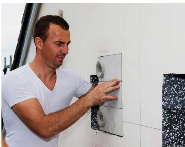
Abb. 9: Auch für Gebäude, die energetisch saniert werden, gibt es Nistkasten-Lösungen, die in die Fassadendämmung eingesetzt werden können (Foto: Johannes Mayer).

nicht im Detail eingegangen wird, weil es hierzu umfangreiche Literatur sowohl im rechtlichen wie auch im fachlichen Zusammenhang gibt (zum Beispiel BLESSING & SCHARMER 2013; RUNGE et al. 2010). Für Bau- und Sanierungsvorhaben an Gebäuden sind dabei insbesondere die Verbote der Verletzung oder Tötung von Tieren sowie der Beschädigung oder Zerstörung ihrer Fortpflanzungs- und Ruhestätten zu beachten. Unter bestimmten Umständen (zum Beispiel wenn größere Fledermaus-Wochenstuben betroffen sind) kann aber auch das Verbot einer erheblichen Störung mit Resultat einer Ver-