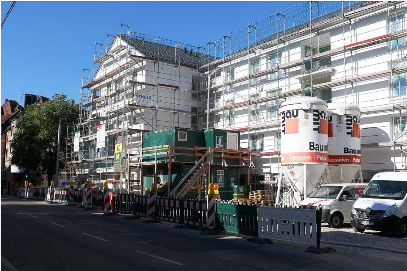
Abb. 7: Neubau- und Sanierungsmaßnahmen beeinflussen Lebensraumstrukturen an Gebäuden im Siedlungsbereich entscheidend. Hier gilt es Konflikte zu erkennen und Potenziale zu nutzen (Foto: Johannes Mayer).

Fig. 7: New construction and refurbishment activities crucially affect habitat structures of buildings in settlements. Conflicts have to be recognized and potentials should be used.